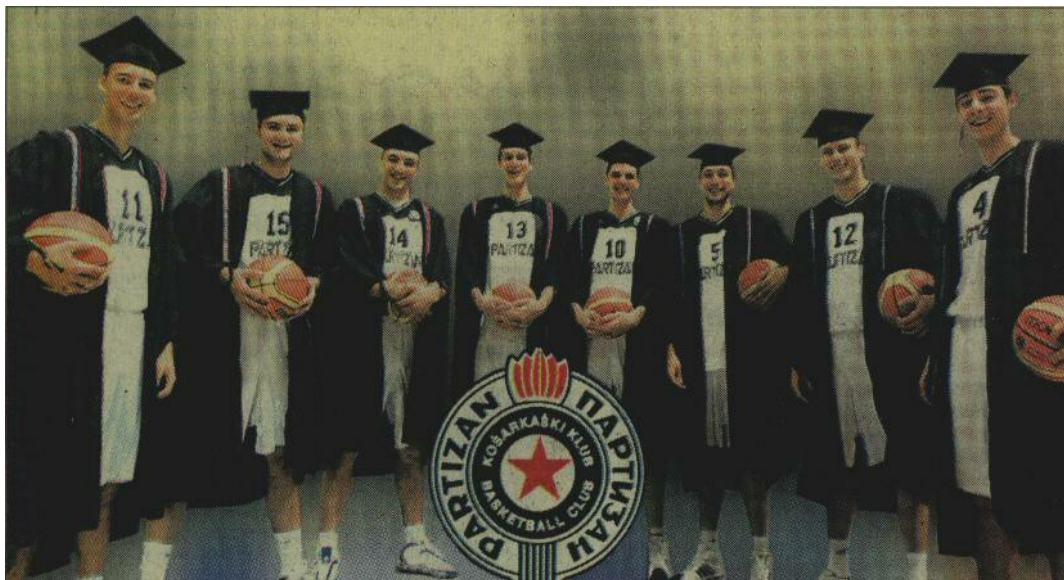
Кошаркаши Партизана на насловној страни Водича за сезону 2006/2007.