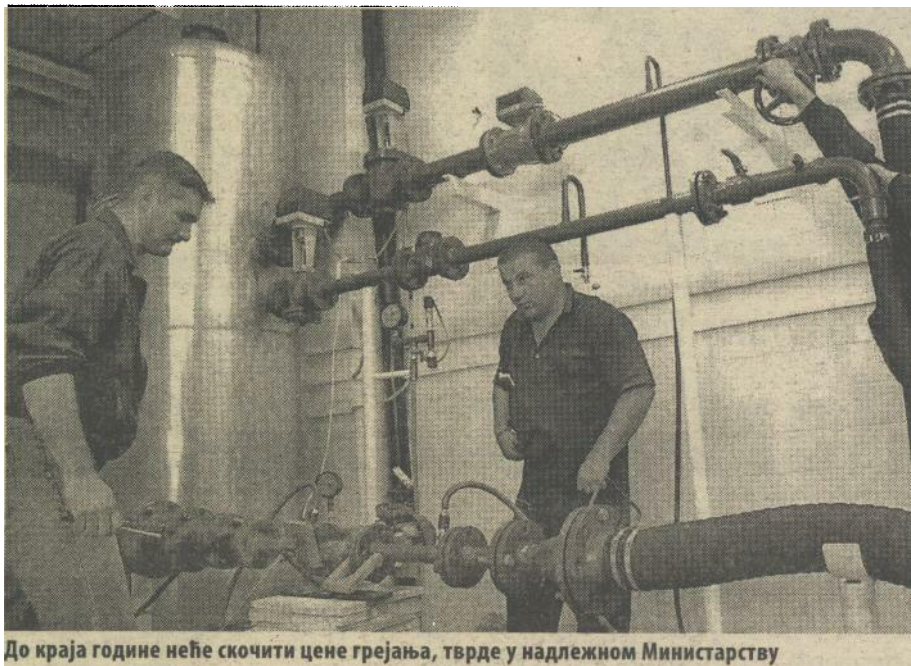
До краја године неће скочити цене грејања, тврде у надлежном Министарству